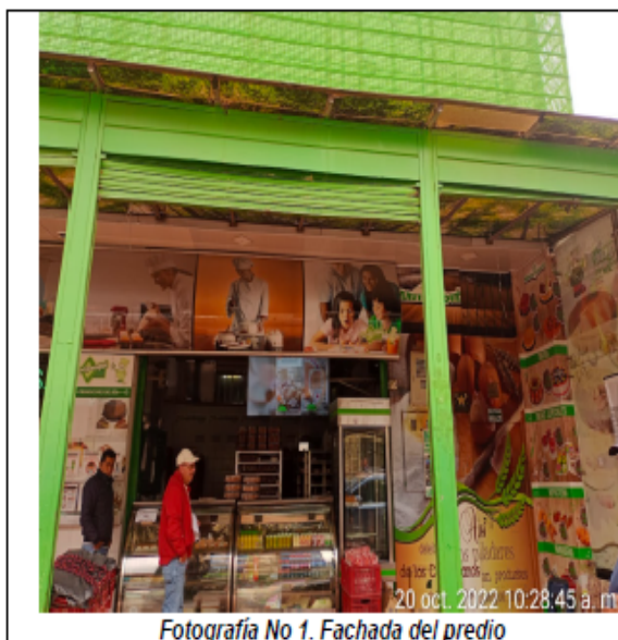
Fotografía No 1. Fachada del predio

El usuario informa que realiza mantenimiento de las trampas de grasas cada 8 días, los residuos generados son entregados a la empresa de aseo del sector. Además, se verificó que la caja de inspección interna (trampa de grasas principal) donde se realiza el aforo y toma de muestras se encontraba colmatada.